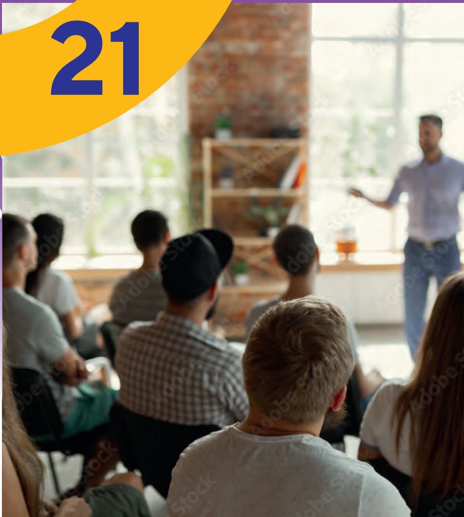
Cours de Français Langue Seconde (FLS) à destination des étudiants internationaux dont le français est la langue seconde.